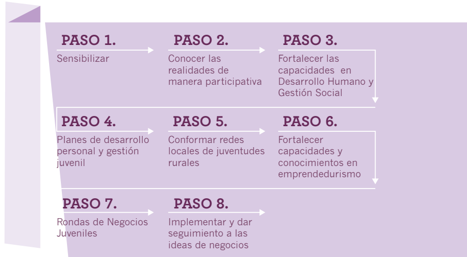
ILUSTRACIÓN 1 PASOS: MODELO DE CAPACITACIÓN EN GESTIÓN SOCIAL Y EMPRENDEDURISMO